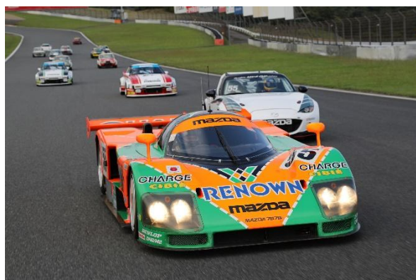
Mazda 787B podczas przejazdu historycznych modeli (2018, Be a Driver. tor FUJI SPEEDWAY)

W ramach tej jazdy pokazowej firma Mazda pragnie pobudzić oczekiwania wobec przyszłości motoryzacji i zadbać o to, by to dziedzictwo zostało przekazane kolejnym pokoleniom.