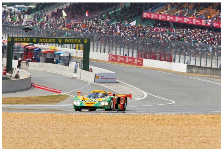
Mazda 787B podczas przejazdu pokazowego z okazji 20. rocznicy zwycięstwa (2011, Circuit de la Sarthe)

Leverkusen, 25 czerwca 2026 r. Mazda Motor Corporation (Mazda) przeprowadzi przejazdy pokazowe Mazdą 787B – samochodem, który zwyciężył w 24-godzinnym wyścigu Le Mans - podczas wydarzenia Le Mans Classic 2026. To jeden z największych na świecie historycznych wyścigów długodystansowych, który odbędzie się na torze Circuit de la Sarthe w Le Mans we Francji w dniach od 2 do 5 lipca 2026 r.