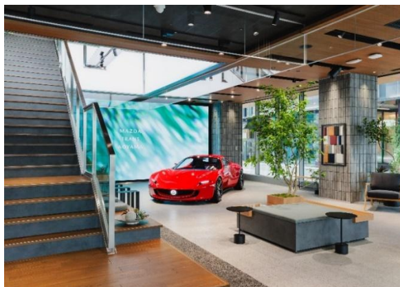
MAZDA TRANS AOYAMA – 1 piętro